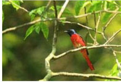
Scientific Name 學名: Pericrocotus flammeus