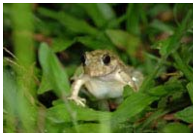
Scientific Name 學名: Rana limnocharis