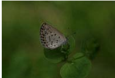
Scientific Name 學名: Zizeeria maha