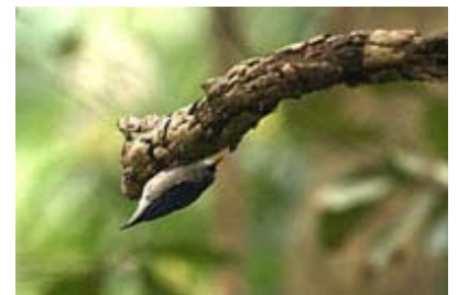
Scientific Name 學名: Sitta frontalis