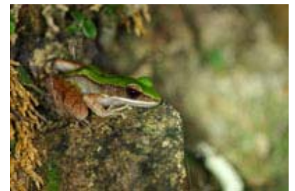
Scientific Name 學名: Rana livida