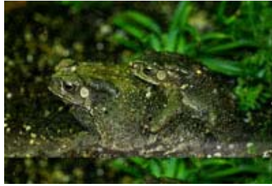
Scientific Name 學名: Bufo melanostictus