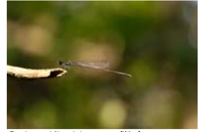
Scientific Name 學名: Prodasineura autumnalis