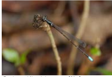
Scientific Name 學名: Drepanosticta hongkongensis

Name in English 英文名: Blue-tailed Shadowdamsel