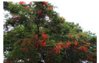
Scientific Name 學名: Delonix regia