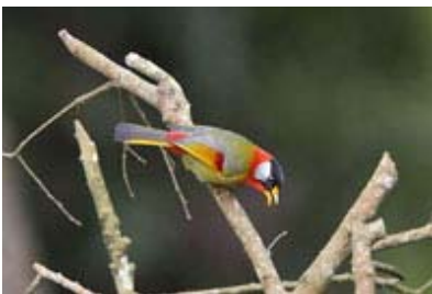
Scientific Name 學名: Leiothrix argentauris