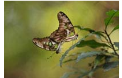
Scientific Name 學名: Graphium agamemnon