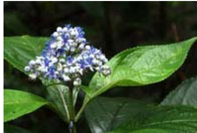
Scientific Name 學名: Dichroa febrifuga

Name in English 英文名: Anti-febrile Dichroa