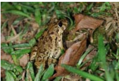
Scientific Name 學名: Rana limnocharis