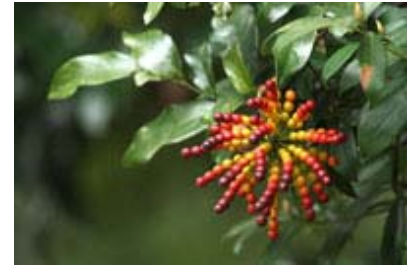
Scientific Name 學名: Desmos chinensis