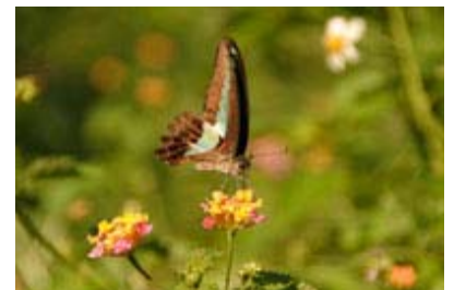
Scientific Name 學名: Graphium sarpedon