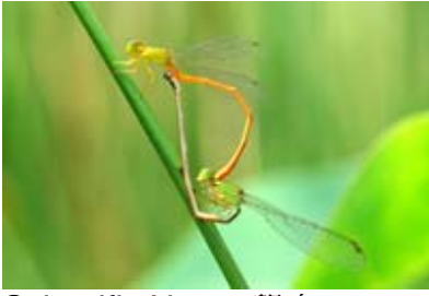
Scientific Name 學名: Ceriagrion auranticum ryukyuanum

Name in English 英文名: Orange-tailed Sprite