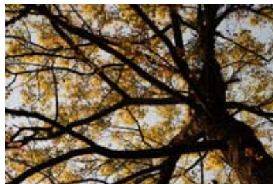
Scientific Name 學名: Liquidambar formosana