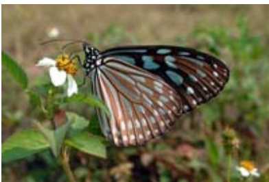
Scientific Name 學名: Ideopsis similis

Name in English 英文名: Ceylon Blue Glassy Tiger