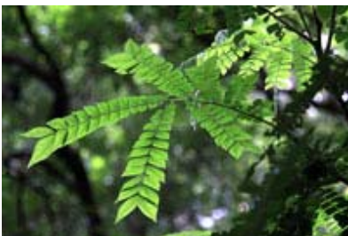
Scientific Name 學名: Archidendron clypearia