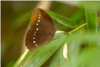
Scientific Name 學名: Faunis eumeus