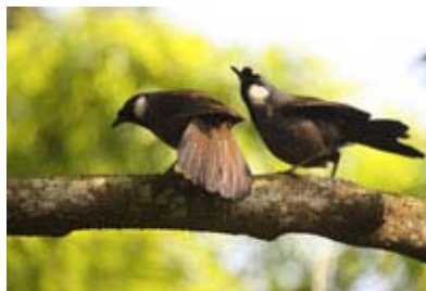
Scientific Name 學名: Garrulax chinensis