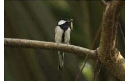
Scientific Name 學名: Parus major