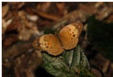
Scientific Name 學名: Cupha erymanthis