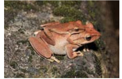
Scientific Name 學名: Polypedates megacephalus