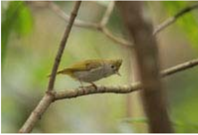
Scientific Name 學名: Yuhina zantholeuca

Name in English 英文名: White-bellied Yuhina