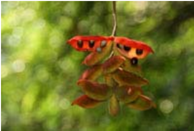
Scientific Name 學名: Sterculia lanceolata

Name in English 英文名: Lance-leaved Sterculia